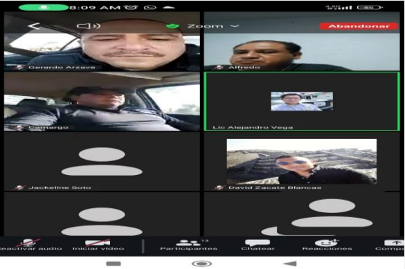
LUGAR: VÍA ZOOM TEOTIHUACÁN