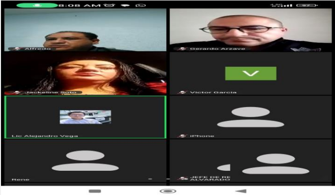
LUGAR: VÍA ZOOM TEOTIHUACÁN