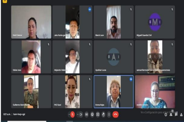
LUGAR: VÍA ZOOM TECÁMAC