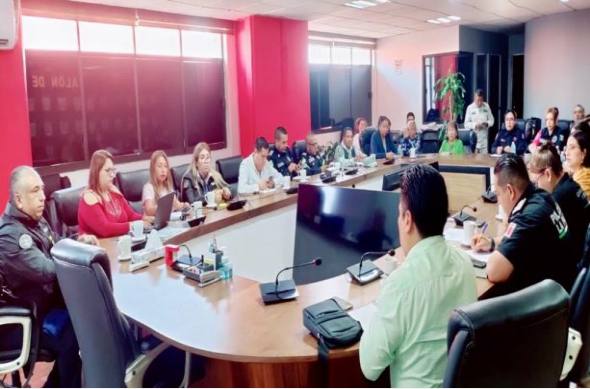
LUGAR: LOS REYES LA PAZ